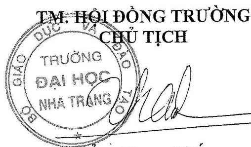
Không Trung Thắng